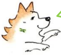
(明塾マスコット犬 サクラ)