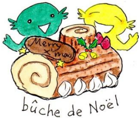
bûche de Noël