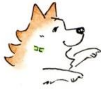
(明塾マスコット犬 サクラ)