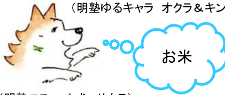
（明塾マスコット犬 サクラ）

オッケー O.K!さくら #85. 新年 OKURAKINTASAKURA 作/ヴァンゆみ