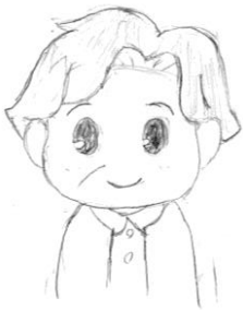
(イラスト 尾谷悠愛さん)

けっこう前に、ひい(大)おばあちゃんが通っている老人ホームで、ふれあいのイベントをやっていた時に、ご年配の方が、しゃてきで、「ぬいぐるみ」をとっていたので、すごいなあと思いました。