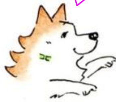
(明塾アンバサダー犬 サクラ)