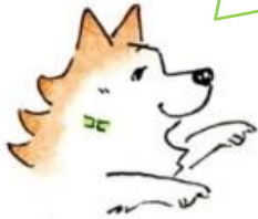
(明塾アンバサダー犬 サクラ)

2枚の絵には、ちがうところが8つあります。みつけたら、右の絵のちがうところに○をつけてね。