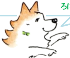
(明塾アンバサダー犬 サクラ)

2枚の絵には、ちがうところが 5個 あります。みつけたら、右の絵のちがうところに O をつけてね。