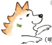
(明塾アンバサダー犬 サクラ)

2枚の絵には、 ちがうところが8つあります。 みつけたら、右の絵のちがう ところに○をつけてね。