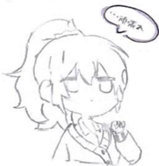
イラスト：内田琴葉さん

最後にまとめてやり最初はせっかくの夏休みなので思いっきり遊ぶのがいいと思います！