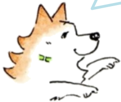
(明塾アンバサダー犬 サクラ)

2枚の絵には、ちがうところが 10 個 あります。みつけたら、右の絵のちがうところに○をつけてね。