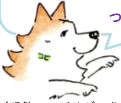
(明塾アンバサダー犬 サクラ)

2枚の絵には、ちがうところが 5個 あります。 みつけたら、 右の絵のちがうところに 〇 を つけてね。