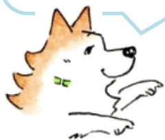
(明塾アンバサダー犬 サクラ)

2枚の絵には、ちがうところを10個あります。みつけたら、右の絵のちがうところに○をつけてね。