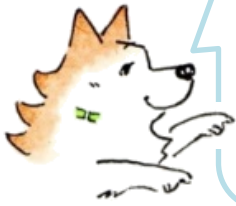
(明塾アンバサダー犬 サクラ)

2枚の絵には、ちがうところが8個あります。みつけたら、右の絵のちがうところに〇をつけてね。